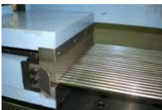
後端クランプですべりがない