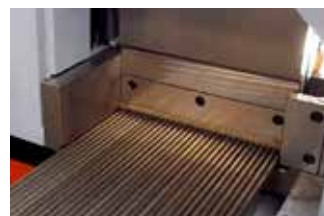
上・横バイスで4面拘束