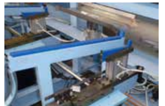
ウォーキングビーム式