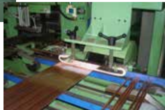
両端バリ取り機も連結可能