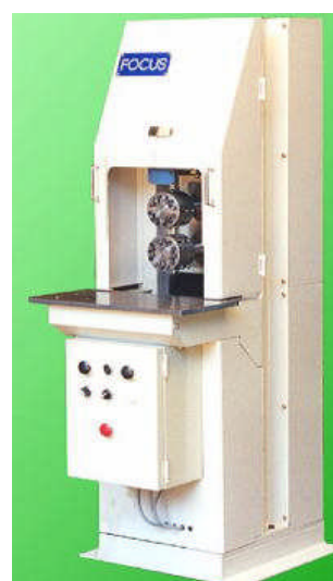
DB-70V型 コンパクトタイプ