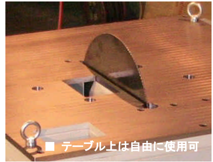
■ テーブル上は自由に使用可