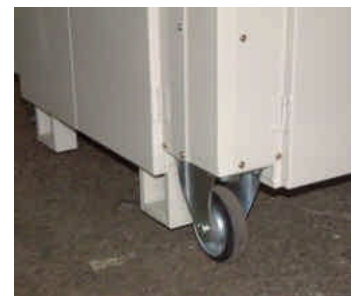
■ 移動車輪 (標準装備)